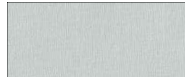
Whitesmook 69492 I