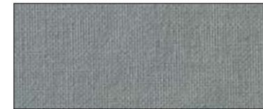
Darkgrey 69493 II