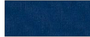
Navy 37936 IV