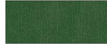
Olive 37699 III