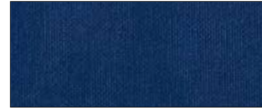
Navy 37936 IV