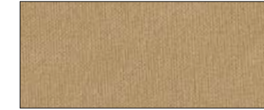
Burlywood 69746 II