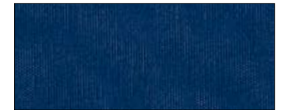
Navy 37936 IV