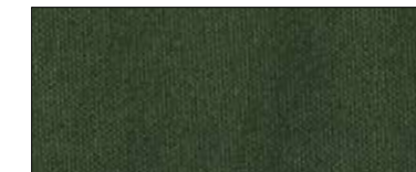
Forest 70107 IV