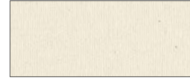
Ivory 00000 I