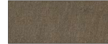
Mocha 70115 III