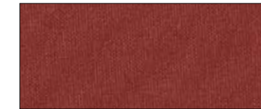
Maroon 69336 IV