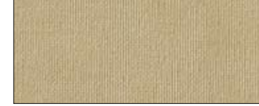
Tan 69745 II