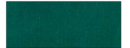
Moss green 40505 IV