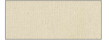
Silk 70063 I