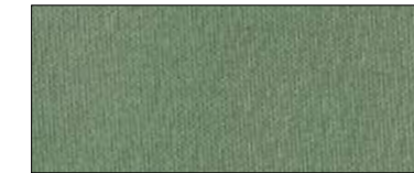
Vern green 69936 II