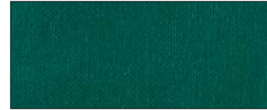
Moss green 40505 IV