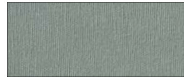
Darkgrey 69493 II