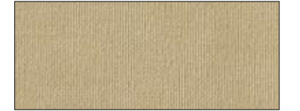
Tan 69745 II