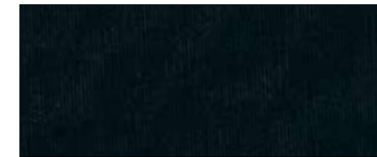
Black 27150 IV