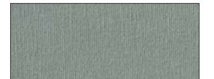
Darkgrey 69493 II

Small colour variations between different production runs may arise as a result of possible changes in the availability of raw materials and dyes. Colours are made to order. For further information, please contact TenCate.